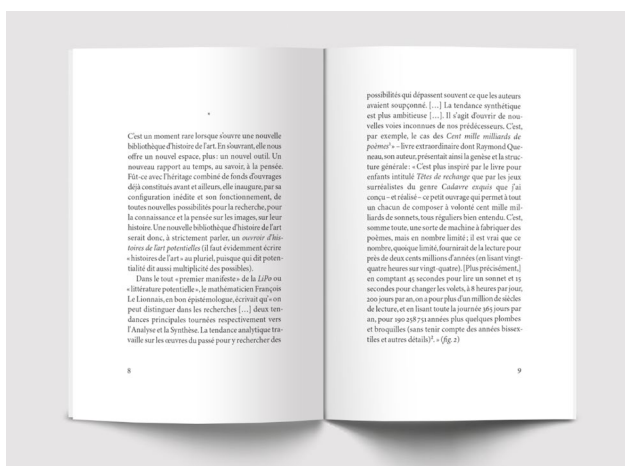
À livres ouverts , Georges Didi-Huberman, p. 8 - 9

« Une nouvelle bibliothèque d'histoire de l'art, ce serait donc l'espace ouvert – ou, plutôt, l'espace ouvrant, ouvrable, l'espace-ouvroir – pour cent mille milliards d'articles, de thèses ou d'ouvrages d'histoire de l'art à venir. Cela veut dire qu'une bibliothèque est bien plus que la somme de ses propres livres. C'est un dispositif d'engendrement d'idées. C'est une machine à inventer des savoirs. » (p. 12-13)