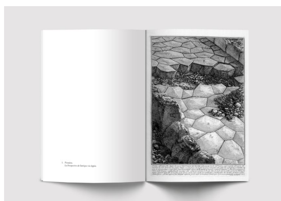
Piranèse ou l'Épaisseur de l'histoire , Alain Schnapp, p. 6 - 7

« Les gravures de Piranèse agrandissent ou réduisent à plaisir les monuments, elles jouent de l'infiniment grand et de l'infiniment petit, elles tordent les perspectives et modulent les premiers plans comme si le graveur, conscient de ses effets, ployait les monuments à son propre plaisir pour les faire parler à sa place. [...] John Wilton Ely a attiré l'attention sur cette remarque de Piranèse: "Les ruines parlantes ont rempli mon esprit d'images que des dessins précis ne m'auraient jamais permis d'exprimer." Les ruines savent parler à qui sait les entendre et c'est cette force même qui s'incarne dans les gravures du maître et dans les commentaires qui les accompagnent. » (p. 12-13)