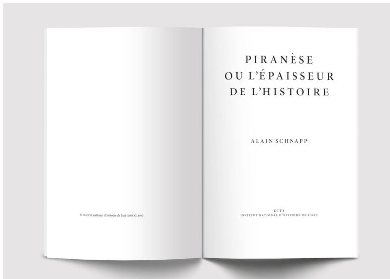
Piranèse ou l'Épaisseur de l'histoire , Alain Schnapp, p. 2 - 3

« Les gravures de Piranèse agrandissent ou réduisent à plaisir les monuments, elles jouent de l'infiniment grand et de l'infiniment petit, elles tordent les perspectives et modulent les premiers plans comme si le graveur, conscient de ses effets, ployait les monuments à son propre plaisir pour les faire parler à sa place. [...] John Wilton Ely a attiré l'attention sur cette remarque de Piranèse: "Les ruines parlantes ont rempli mon esprit d'images que des dessins précis ne m'auraient jamais permis d'exprimer." Les ruines savent parler à qui sait les entendre et c'est cette force même qui s'incarne dans les gravures du maître et dans les commentaires qui les accompagnent. » (p. 12-13)