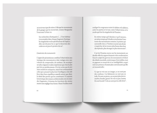
Piranèse ou l'Épaisseur de l'histoire , Alain Schnapp, p. 10 - 11