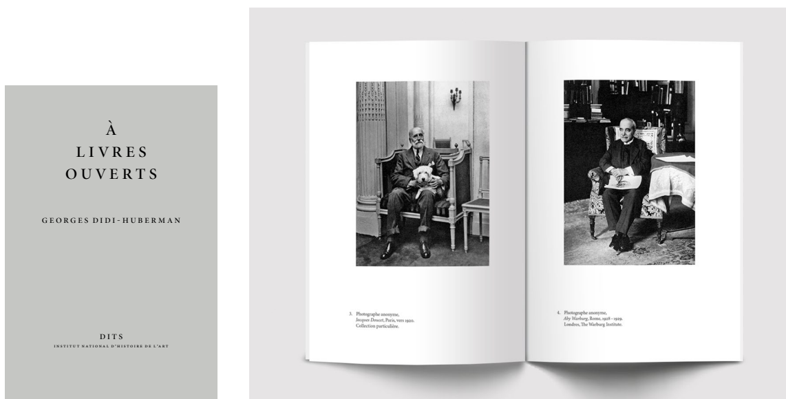
À livres ouverts , Georges Didi-Huberman, p. 20 - 21

Le premier titre, À livres ouverts , est la transcription de la conférence prononcée par le philosophe et historien de l'art Georges Didi-Huberman le samedi 14 janvier 2017, pour la réouverture de la bibliothèque de l'INHA, dans la salle Labrouste à Paris. L'auteur y salue l'ouverture de la bibliothèque comme celle d'un « ouvroir d'histoires de l'art potentielles ».