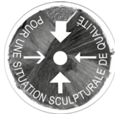
Émilie Perotto, Pour une situation sculpturale de qualité