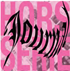
Matthieu Blond, Hors-série de Journal