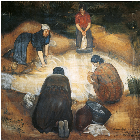
Francis Harburger, Les Lavandières , 1929, huile sur toile, Castres, musée Goya-musée d'Art hispanique; Credit photo : Jean-Claude Ouradou

Lorsqu'elle entreprit d'élaborer le catalogue raisonné de l'œuvre peint de Francis Harburger (1905-1998), Sylvie, sa fille, fut confrontée à la réalité du pillage qui fit disparaître les toiles exécutées par l'artiste avant la guerre.