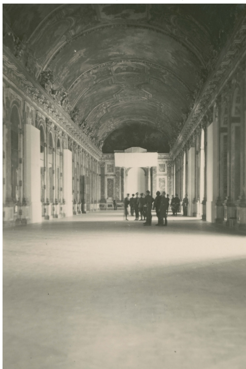
La galerie des Batailles du château de Versailles, prise par un soldat allemand (entre juin 1940 et août 1944)