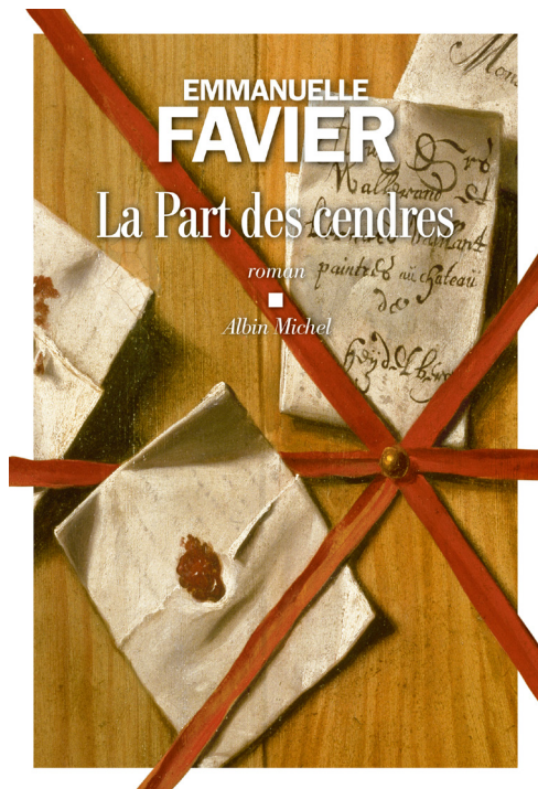
Couverture du roman d'Emmanuelle Favier, La part des cendres , Albin Michel, 2022

La Part des cendres , paru en août 2022, roman d'histoire et de l'histoire, est au cœur du voyage des objets à travers les siècles, au fil des générations, en passant par les spoliateurs nazis, jusqu'à l'époque de la recherche et de