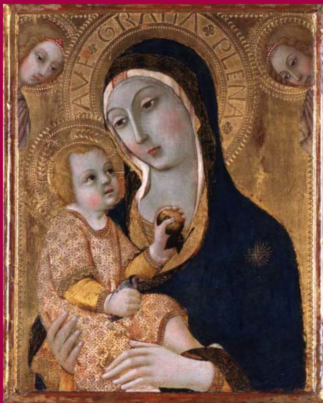
Sano di Pietro (1406 – 1481), La Vierge et l'Enfant , Quimper, musée des Beaux-Arts

Conditions d'accès Entrée libre, sous réserve des places disponibles