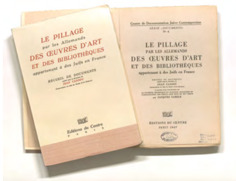
Jean Cassou (dir.), Le pillage par les Allemands des œuvres d'art et des bibliothèques appartenant à des Juifs en France , Paris, Éditions du Centre de Documentation Juive, 1947.

La spoliation des biens culturels : quelle juste place dans l'histoire et la mémoire de la Shoah ?