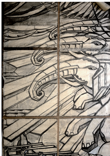
Jacques Gruber, détail du carton pour le vitrail La Chasse, vers 1927. Paris, musée des Arts décoratifs, département des Arts graphiques, Inv. 49 324.

L'inventaire du fonds de cartons de Jacques Gruber conservé au département des Arts graphiques du musée des Arts décoratifs a été réalisé en 2013. Il ouvre des voies nouvelles vers la connaissance de l'un des plus importants peintres verriers de l'Art déco. Ces plus de 250 dessins à grande d'exécution, réalisés entre 1914 et 1930 environ, témoignent d'une étape majeure de l'élaboration d'œuvres célèbres, dont plusieurs ont figuré à l'exposition de 1925. Ils permettent aussi d'explorer une part totalement inconnue de la production de Jacques Gruber, destinée à une clientèle privée. Cependant, faute de pouvoir être relié à un catalogue des œuvres et aux archives de l'atelier, aujourd'hui disparues,