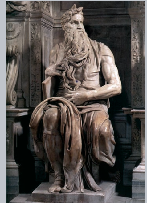
Michel-Ange, Moïse, Rome, Saint-Pierre-aux-Liens