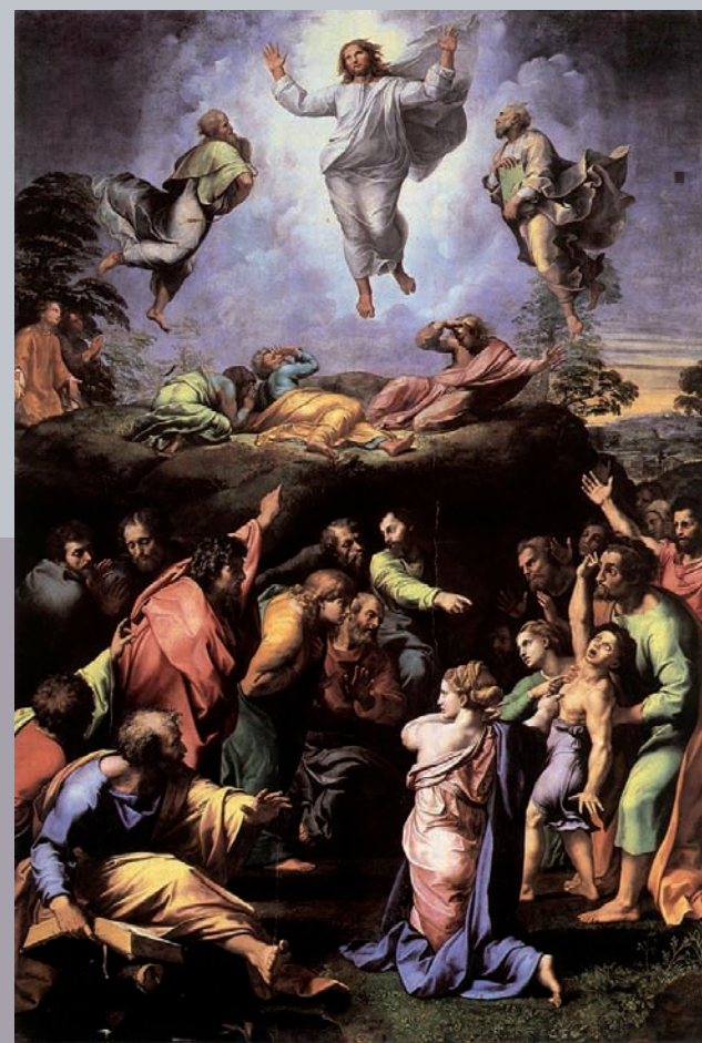
Raphaël, Transfiguration, Vatican, Pinacothèque Vaticane