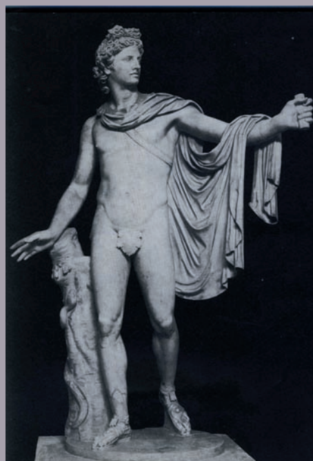
Apollon du Belvédère, Vatican, Museo Pio Clementino

Pour plus de renseignements : melissa.pelisson@upmf-grenoble.fr