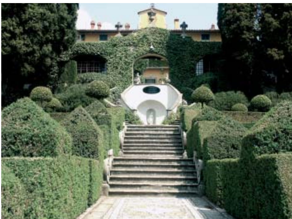
Vue de l'entrée de la Villa I Tatti . Reproduced by permission of the President and Fellows of Harvard College, Villa I Tatti , Florence. Photographe: Giovanni Trambusti

anglo-italien, par l'architecte paysagiste anglais Cecil Pinsent. Aux environs de 1920, la collection de peintures était complètement constituée et, dès lors, les Berenson consacrèrent leurs ressources à l'acquisition de livres et de photographies. La bibliothèque s'agrandit en 1909, 1915, 1923 et dans les années 1948-1954; la construction d'un nouveau bâtiment en 1985 permit d'en doubler la surface. Conformément au rêve de Berenson, la Villa est devenue une bibliothèque attachée à une demeure. L'estime que portait Berenson à Harvard remonte à sa jeunesse. C'est à l'âge de dix ans qu'il arriva à Boston, simple immigré lithuanien désargenté, mais son esprit brillant fut vite reconnu et le soutien des membres les plus riches de la société bostonienne lui permit de poursuivre ses études au Harvard College, où il fut diplômé en 1887. Il s'intéressait alors à la littérature et aux langues anciennes. Il se forma lui-même à la connaissance de la peinture primitive italienne au cours de voyages qu'il effectua, à partir de 1887, à travers l'Europe et plus particulièrement en Italie. Dès 1915, il manifesta son