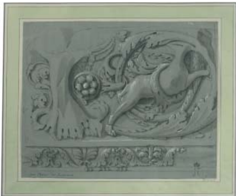
Charles-Louis Clérisseau (1721-1820), Entablement de la Domus Flavia , Palatin (découverte de 1725), plume, lavis et gouache, 21,5 x 26,5 cm. Saint-Petersbourg, Musée de l'Ermitage