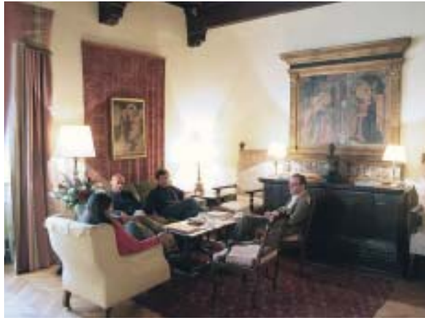
Un salon dans la Villa I Tatti . Reproduced by permission of the President and Fellows of Harvard College, Villa I Tatti , Florence. Photographe : Giovanni Trambusti