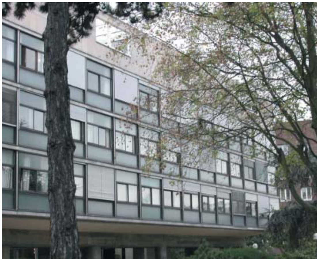
Un jour de juin à la Cité Universitaire de Paris.

La fondation Le Corbusier, qui gère depuis longtemps les droits sur les images de son fonds, prétend maintenant aussi toucher des droits sur les photographies des bâtiments de Le Corbusier. Ailleurs ce sont les propriétaires, l'État, des communes ou des particuliers, qui prétendent percevoir des droits sur l'image des monuments qui leur appartiennent. Il y a là un curieux détournement, qui rappelle étrangement la mise en place de la féodalité, avec ses privilèges, ses fiefs et ses péages.