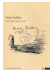
Figure tutélaire de l'histoire de l'art français, Henri Focillon (1881-1943) fut professeur d'histoire de l'art à l'université de Lyon et directeur des musées de la ville de 1913 à 1924.

Il enseigna ensuite à la Sorbonne, au Collège de France puis aux États-Unis où il choisit de s'exiler. Tout au long de sa carrière, Focillon marqua plusieurs générations d'élèves, mais aussi de lecteurs éblouis par l'ampleur de son savoir et ses qualités d'écrivain. La diversité des sujets abordés et l'éventail des périodes prises en compte reflètent la richesse de ses intérêts et son goût pour les chemins de traverse. Cet ouvrage, qui réunit les études de plusieurs spécialistes, évoque les différentes facettes de sa pratique d'historien de l'art et les étapes de sa carrière, son engagement dans le siècle, la multiplicité de ses objets de recherche et sa prédilection pour le domaine de l'estampe. L'analyse comparée des travaux de Focillon et de ses grands contemporains, notamment en Allemagne et en Italie, permet d'inscrire sa démarche dans un faisceau de relations au sein desquelles émerge sa singularité. Loin de ne constituer qu'un simple hommage au plus fameux des historiens de l'art français du XX e siècle, cet ouvrage collectif offre enfin l'occasion de s'interroger de façon critique sur l'héritage d'Henri Focillon : ce qu'il reste aujourd'hui, dans nos pratiques et nos méthodes, de l'œuvre intellectuelle de l'auteur de la Vie des formes . Le colloque, dont ces actes rendent compte, a été organisé par l'INHA et l'université Lumière Lyon II en mars 2004.