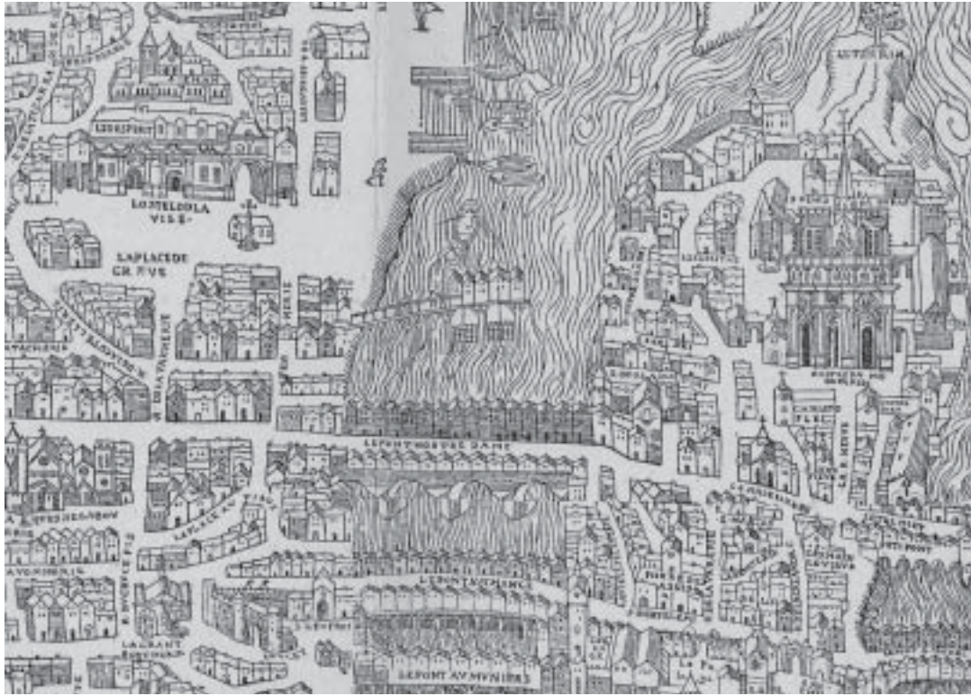
Plan de Paris sous Henri II, par Truschet et Hoyau, dit Plan de Bâle , après 1553, reproduit en fac-similé dans Fedor Hoffbauer, Paris à travers les âges , Firmin Didot (coll. Centre André Chastel)

plan actuel, comme celui que Pierre Pinon avait esquissé, sous l'égide de l'Inventaire général, sur deux siècles d'opérations d'urbanisme dans les IX e et XII e arrondissements (1750-1950).